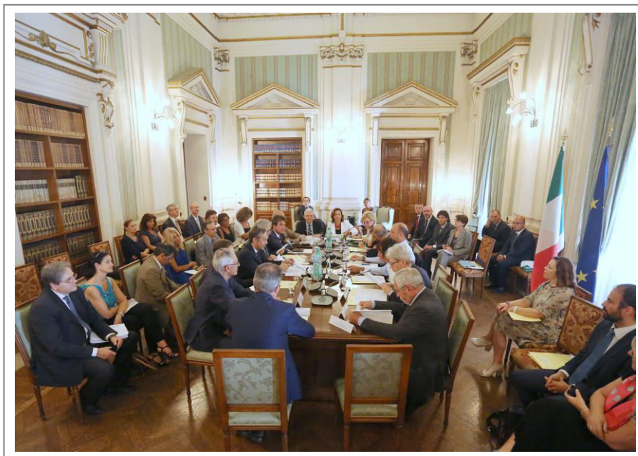
Seduta della Conferenza Stato-Città ed autonomie locali del luglio 2015

Tra dicembre 2014 e fine marzo 2015, con la nostra presenza nel Direttivo nazionale dell'Unione Province d'Italia , il nostro impegno e costante lavoro in Conferenza Stato-Città ed in Conferenza Unificata , siamo riusciti a garantire alla nostra Provincia un ruolo da protagonista nel confronto col Governo.