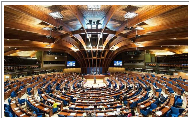
Seduta plenaria del Congresso dei poteri locali del Consiglio d'Europa

S erve verità in questo Paese e non bisogna avere paura di spiegarla: con decisione e perseveranza, in ogni luogo, in ogni occasione, senza temere di infastidire chi comanda, sia esso il Governo o le nuove striscianti lobby economiche.