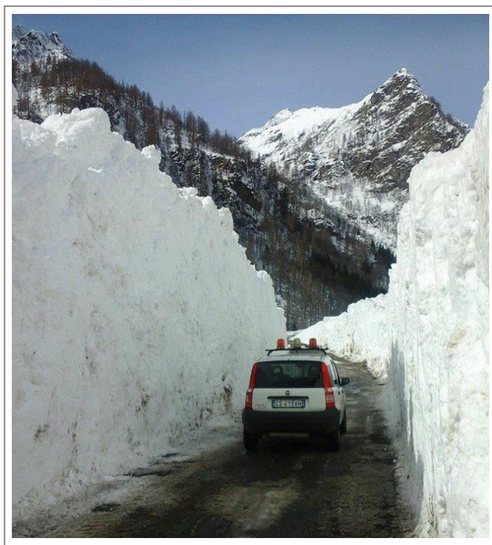
SP10 Rimasco-Rima liberata da una slavina il 3 marzo 2016

Entusiasmo col contagocce, per carità; ma pensare di aver riaperto il ponte di Casanova Elvo, la "Cremosina", la "Colma" in pochi mesi sono quelle piccole azioni che ripagano gli sforzi e danno fiducia alle istituzioni.